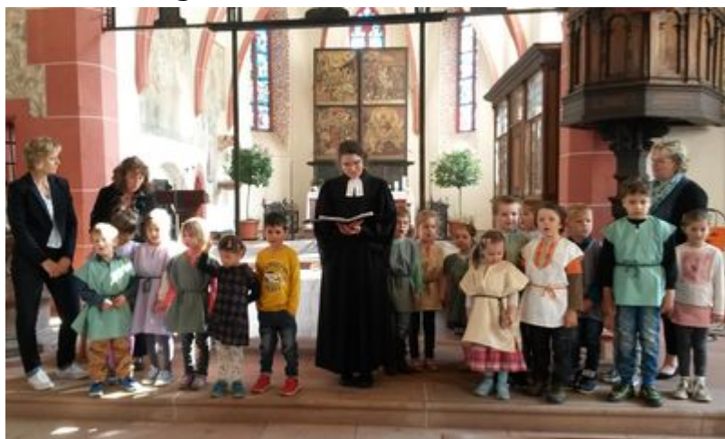
der Evangelischen Kindertagesstätte