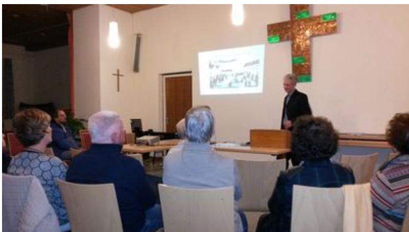
Leben und Lieder, Reformation in Babenhausen Bericht Babenhäuser Zeitung vom 14.10.2017