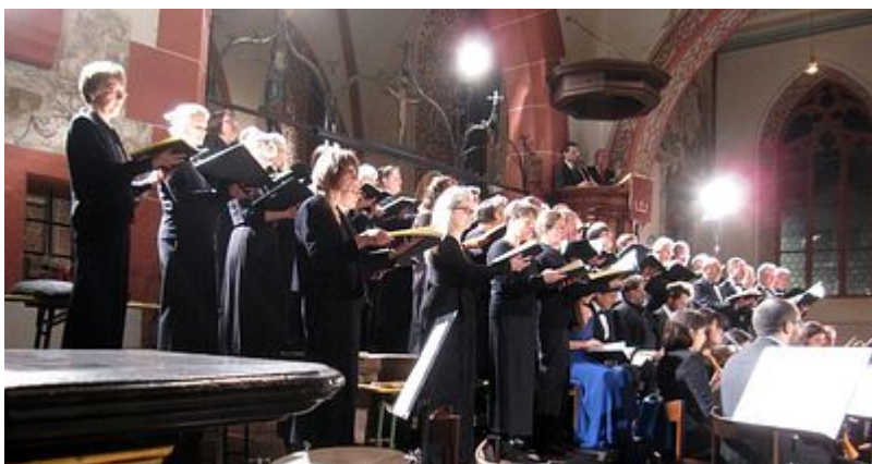
Konzertchor Darmstadt und Darmstädter Hofkapelle