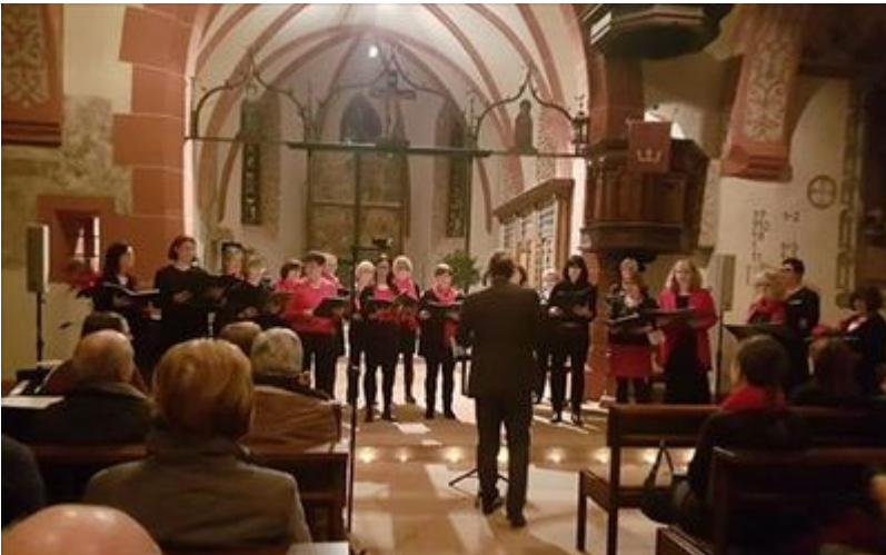
Women and Voices