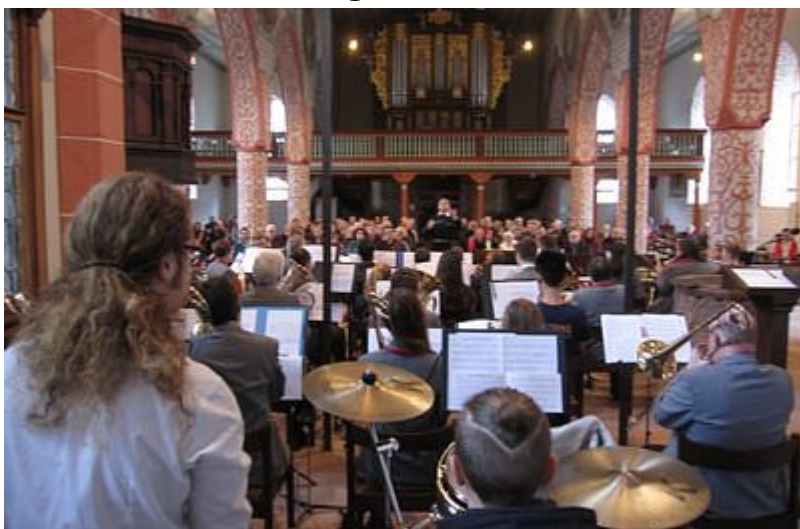
mit dem Blasorchester Babenhausen