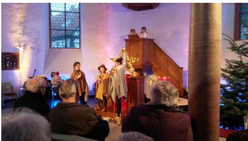
Bericht Babenhäuser Zeitung vom 22.12.2017