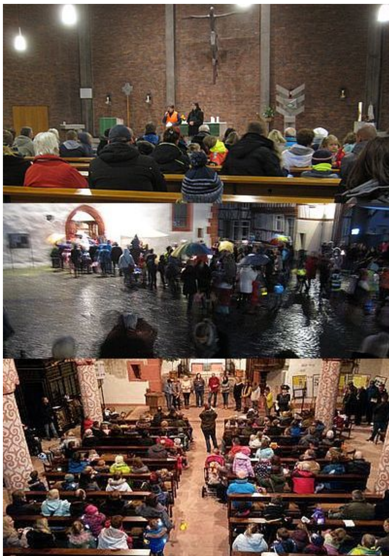
Beginn in St. Josef, Einzug in die Stadtkirche + Klangspiel