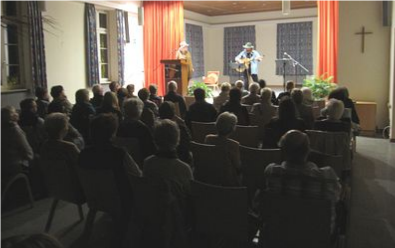
Giselle + Ramblin' Wolf