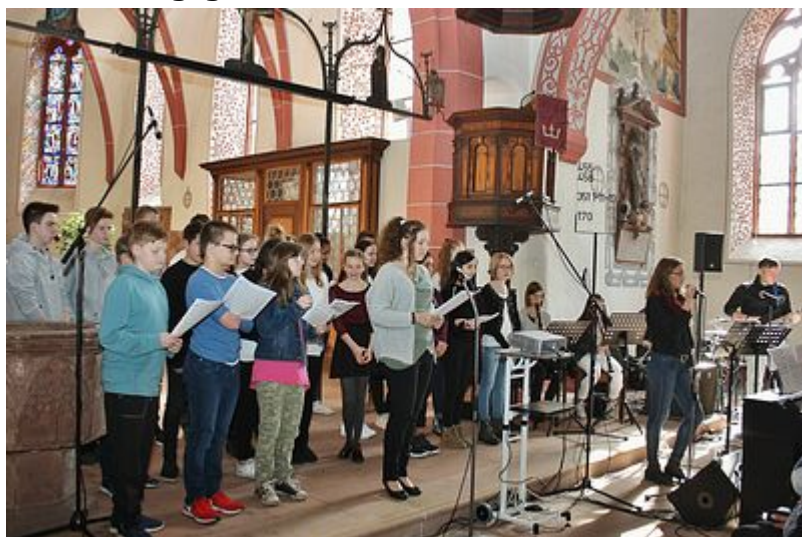
Pfarrbezirk Ost + Harreshausen